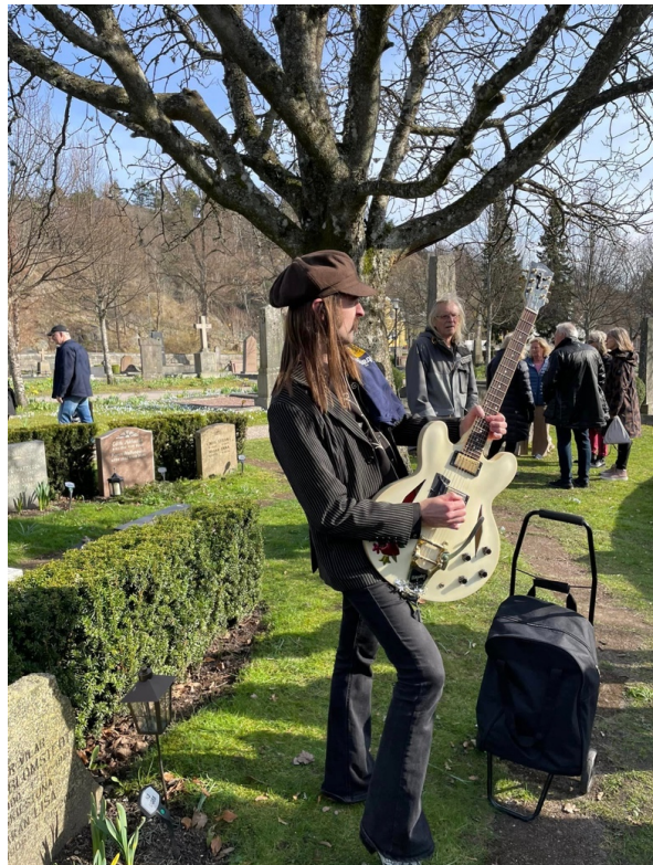
Calle med Roberts Gibson ES 335 Diamond